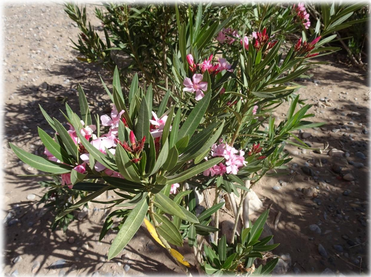
De oleander is een rijk vertakte, bossige, 2-6 m hoge struik die giftig melksap bevat in alle vegetatieve delen. De bladeren zijn leerachtig en 10-22 cm lang. De geurige bloemen