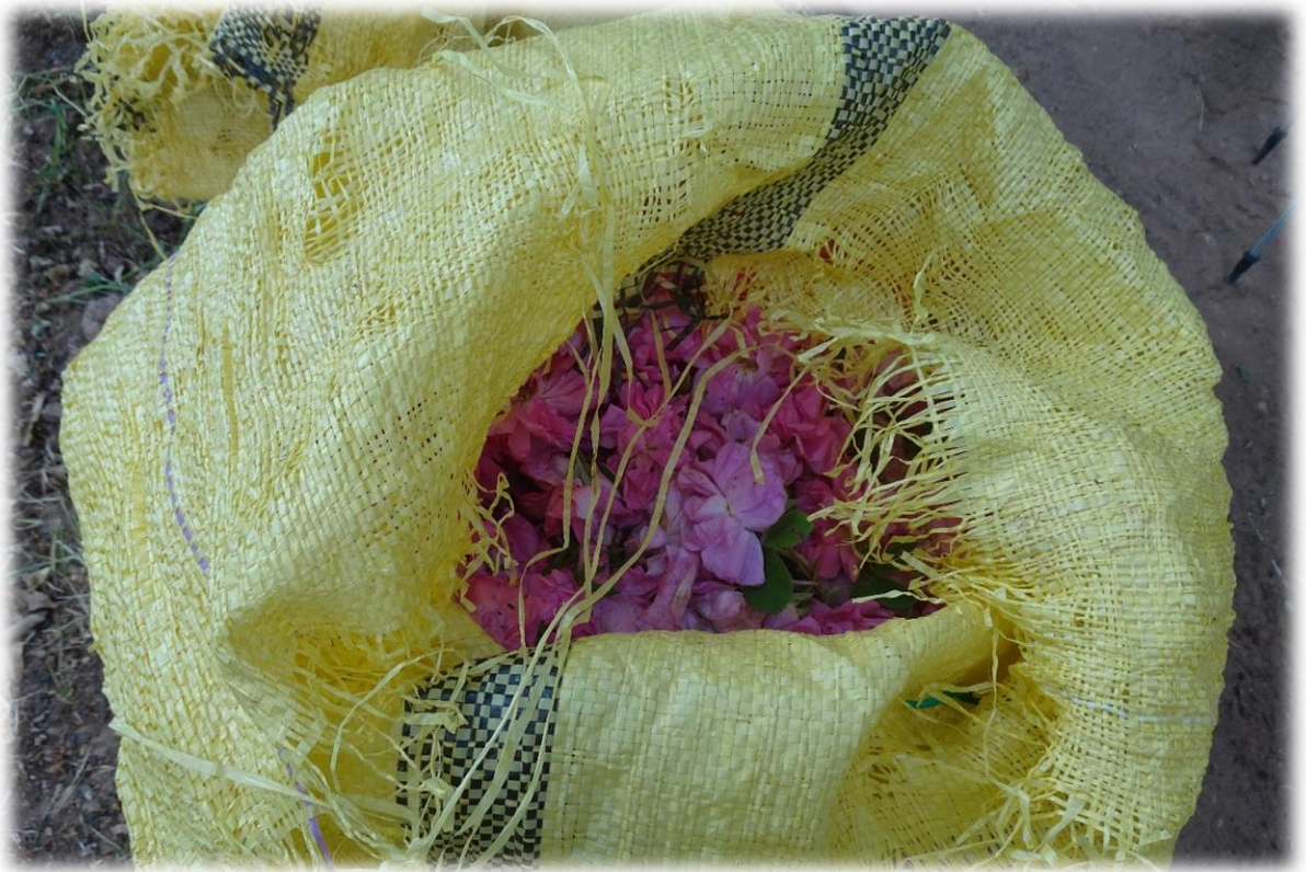
De bewoners plukken de bloemblaadjes waarna deze in zakken worden opgeslagen.