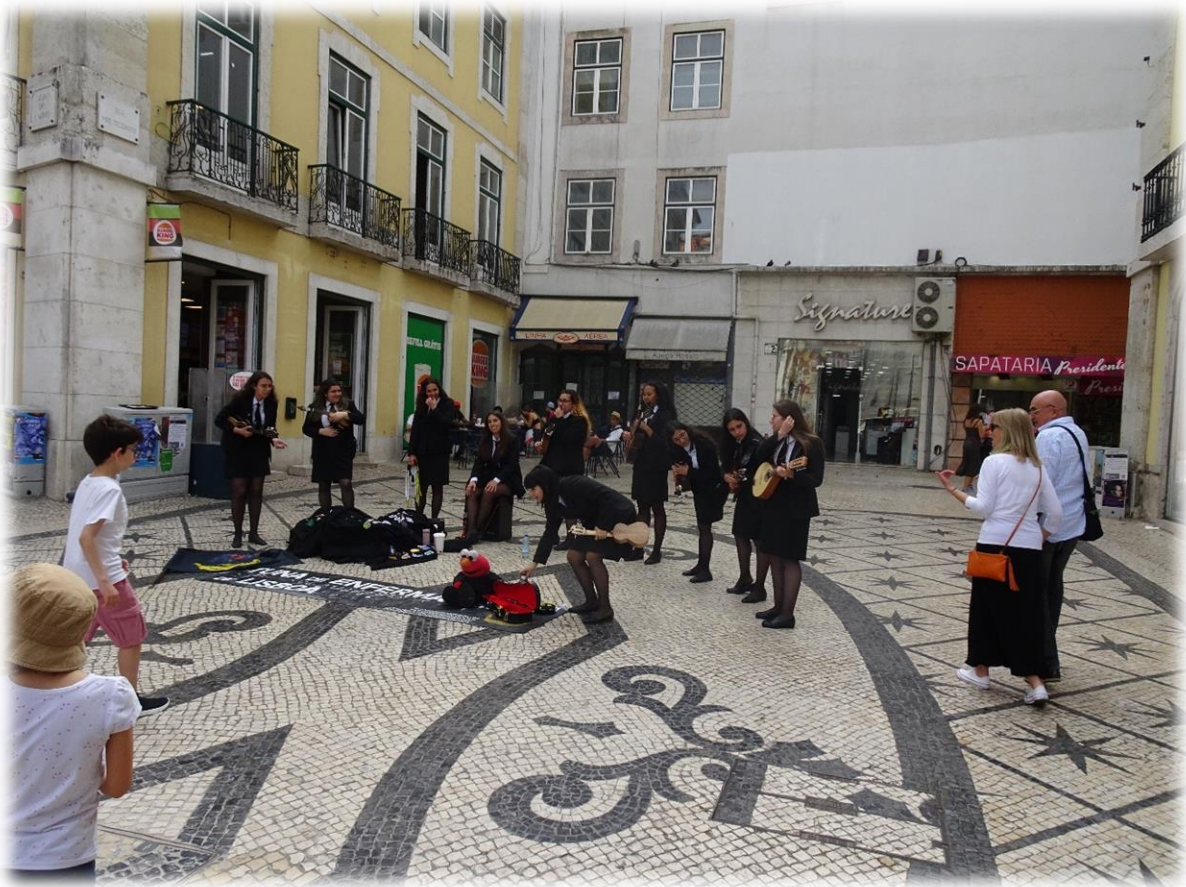
Hier in Portugal is het duidelijk minder warm dan in Marokko maar het is hier toch ook mooi en zonnig weer.