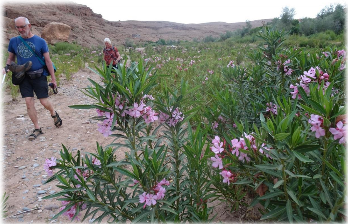
De oleander komt voor in het Middellandse Zeegebied, Zuid Portugal en van Iran tot in Oost-Azië. Hij komt voor op stenige gronden, overstromde oevers en in periodiek droge beekbeddingen.